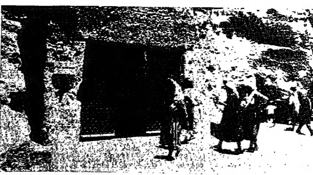
كف «الصديق شمعون» الذي اكتشفه الاسرائيليون قرب وحدات للجناح في الشيخ حراج وصنعوا له بابا وانفذوا منه حجة تهجير سكان المنطقة «مورة خاصة بالستور»